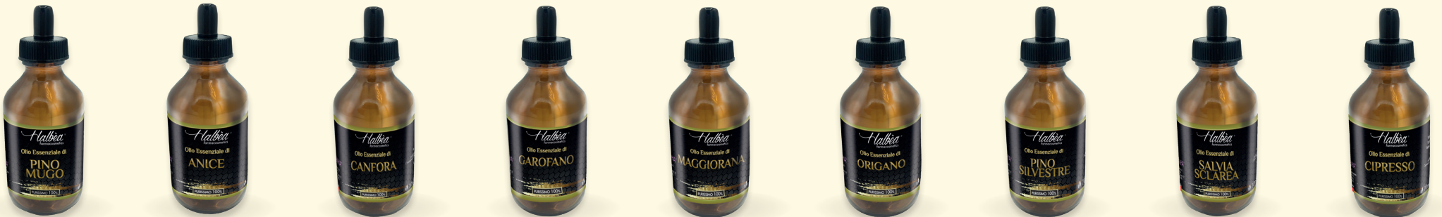
€ 22,49 Pino Mugo Pin de Montagne Bergkiefer Pino de Montaña HFP-OEP10ML-PINMUG