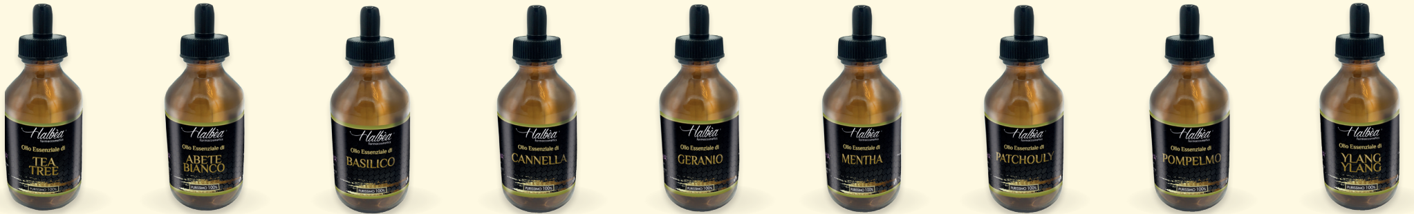
€ 12,99 Tea Tree Tea Tree Tee Baum Tea Tree HFP-OEP10ML-TEATREE