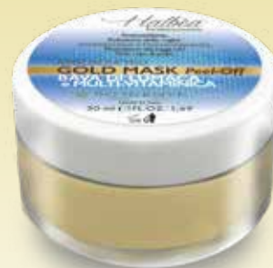
| BAVA DI LUMACA e MULTIVITAMINICA