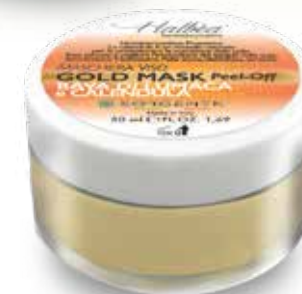
| BAVA DI LUMACA e CALENDULA