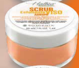
AGRUMI AGRUMES ZITRUS CÍTRICAS HF-SVEA50