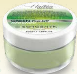
GREEN MASK Peel-Off AVOCADO