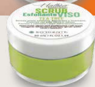
TEA TREE TEEBAUM TEA TREE HF-SVETT50