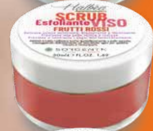
FRUTTI ROSSI FRUITS ROUGES ROTE FRUCHTE FRUTOS ROJOS HF-SVEFR50