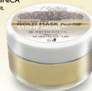
| BAVA DI LUMACA e LATTE D'ASINA