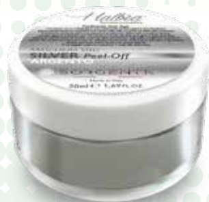
SILVER MASK Peel-Off